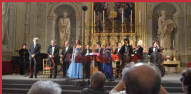
Roma, Palazzo del Quirinale - Cappella Paolina