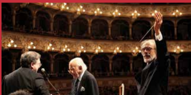
Bari, Teatro Petruzzelli, Bif&st, concerto con Armando Trovajoli