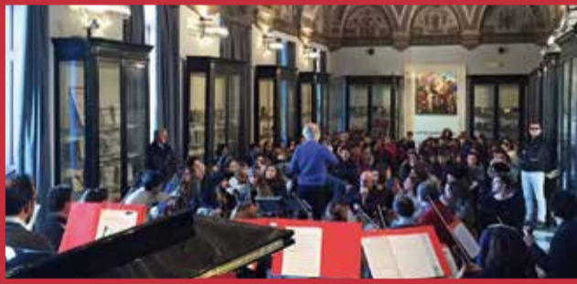
Università degli Studi di Bari “Aldo Moro”, Salone degli Affreschi