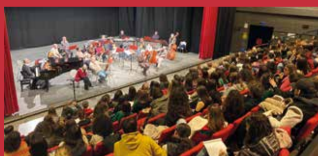
Nuovo Teatro Abeliano, concerto matinee per le scuole