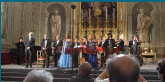
Roma, Palazzo del Quirinale - Cappella Paolina