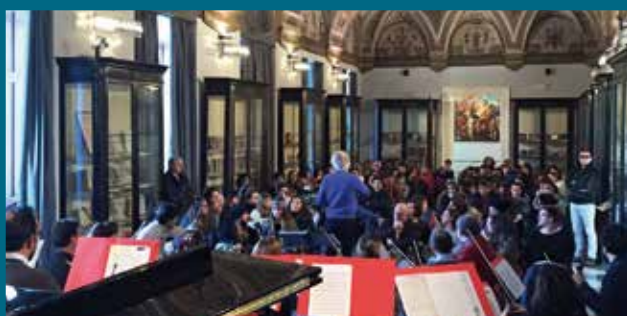
Università degli Studi di Bari “Aldo Moro”, Salone degli Affreschi