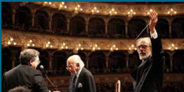
Bari, Teatro Petruzzelli, Bif&st, concerto con Armando Trovajoli