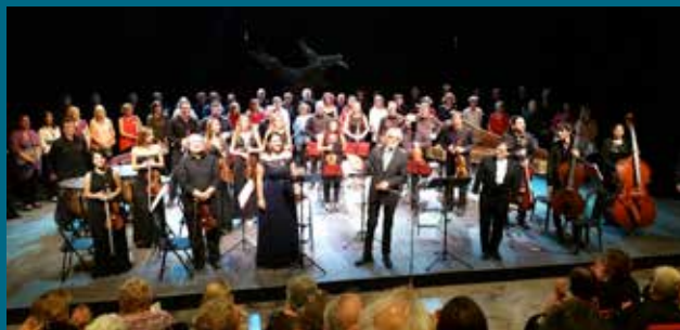
Bari, Nuovo Teatro Abeliano