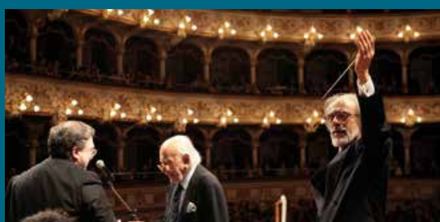
Bari, Teatro Petruzzelli, Bif&st, concerto con Armando Trovajoli