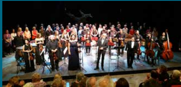
Bari, Nuovo Teatro Abeliano