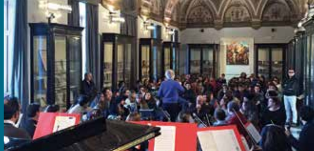
Università degli Studi di Bari “Aldo Moro”, Salone degli Affreschi