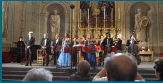
Roma, Palazzo del Quirinale - Cappella Paolina